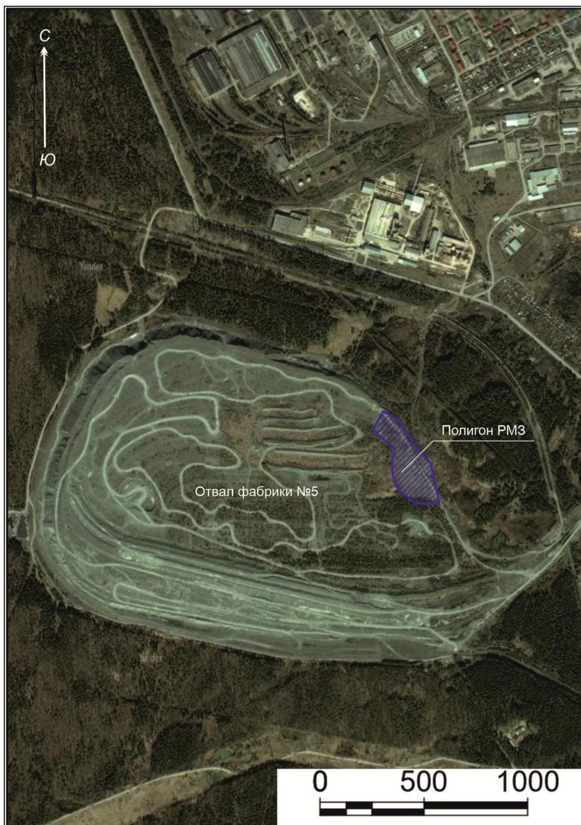
Рисунок 3 – Обзорная схема района расположения объекта рекультивации (вид со спутника [21]).