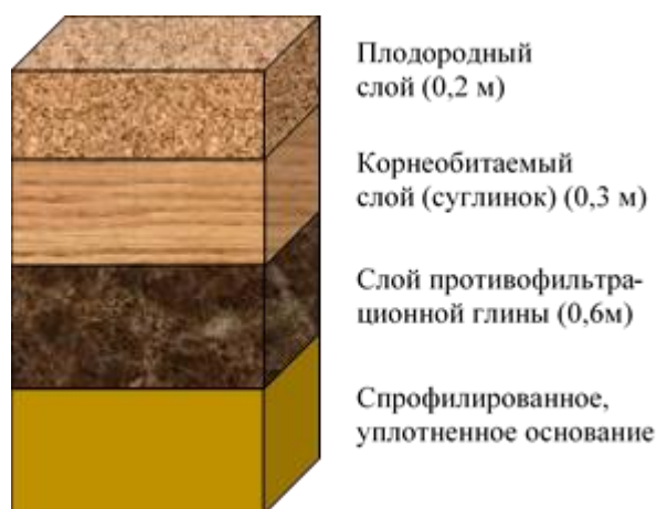
Рисунок 1 – Структура противofильтрационного экрана

Технические работы при проведении рекультивационных работ (технический этап рекультивации) будут включать следующие этапы: